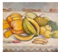
Yoryi Morel Bodegón Tropical , 1959 Óleo sobre tela Colección Centro León