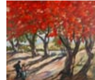
Yoryi Morel Flamboyanes con figuras , 1970 Óleo sobre tela Colección Centro León