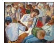
Yoryi Morel Bachata , 1941 Óleo sobre tela Colección Museo de Arte Moderno