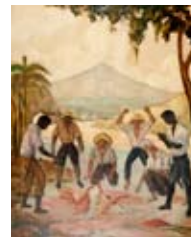
Yoryi Morel Pelea de gallos , 1951 Óleo sobre madera Colección Centro León

En la obra de Yoryi Morel es posible interactuar con nuestra cultura popular, especialmente por el manejo del ambiente rural: las casas y sus formas pintorescas, los juegos tradicionales que ambientan el mundo lúdico de nuestro campesino (como las peleas de gallos y las fiestas en su apogeo bajo una enramada), hasta los espacios de religiosidad rural.