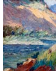
Yoryi Morel Sin título , sin fecha Óleo sobre tela Colección Bellapart