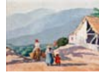
Yoryi Morel Paisaje con marchanta y transeúnte , 1930 Óleo sobre tela Colección Centro León