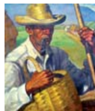
Yoryi Morel Campesino cibaeno , 1946 Óleo sobre tela Colección Museo de Arte Moderno