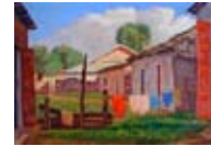
Yoryi Morel Tendedizo , 1941 Óleo sobre tela Colección Museo Bellapart

Este artista encuentra en su entorno rural el motivo fundamental para trabajar la pintura. El paisaje es uno de los elementos esenciales en la obra de Yoryi Morel. Su pincelada es corta y enérgica, acentuada por el juego de luces y sombras. La gama cromática utilizada por el artista tiende a los colores pasteles y brillantes, que captan la realidad de la luz caribeña y realzan la sutileza y delicadeza de la naturaleza.