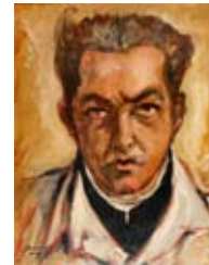
Yoryi Morel Autorretrato , 1955 Óleo sobre plywood Colección Centro León