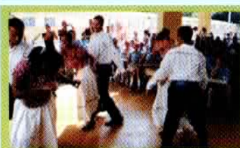
Escuela Ana Josefa Jiménez.

LA CULTURA EN LAS ESCUELAS. Martes 10 y viernes 20. Cierre del Curso Taller de Folklore. Presentación Ballet Folklórico Juvenil del Viceministerio.