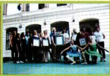
Entrega de certificados de participación a Escuelas de Danza.

LA CULTURA EN LOS MUNICIPIOS. Sábado 30. Visita Guiada al Monumento a los Héroes de la Restauración con los estudiantes de la Provincia de Sabana Iglesia.