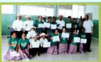
Entrega de certificados a estudiantes de la Escuela Eugenio Deschamps.

LA CULTURA EN LOS CLUBES. Jueves 12. Conferencia: "El Clubismo en Santiago", Alfredo Matías. Club Baracoa.