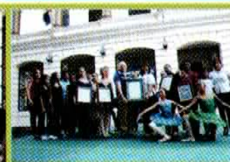
Entrega de certificados de participación a Escuelas de Danza.

LA CULTURA EN LOS MUNICIPIOS. Sábado 30. Visita Guiada al Monumento a los Héroes de la Restauración con los estudiantes de la Provincia de Sabana Iglesia.