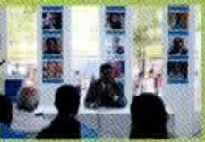
Visita de escritores y talleristas de Santiago. Café Bohemio, domingo 15.