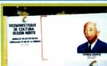
Escuela Onésimo Jiménez.