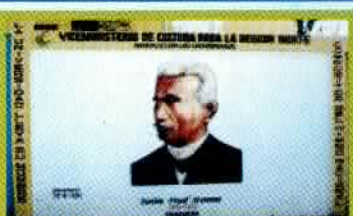
Universidad Emilio Prud' Homme.

INAUGURACIÓN DE LA EXPOSICIÓN "AMOR AL ARTE", Viernes 20. Artistas Colectivos. Palacio Consistorial de Santiago.