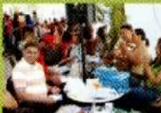
El Ministerio de Cultura edita libros de escritores de Santiago en la Feria Internacional del Libro 2011.